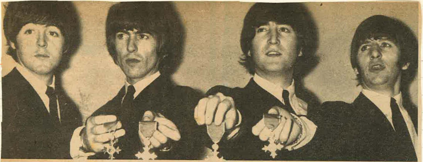
قبل أن يفترقوا : رينغو ستار ، جون لينون ، جورج هاريسون ، توم كورتنبي .